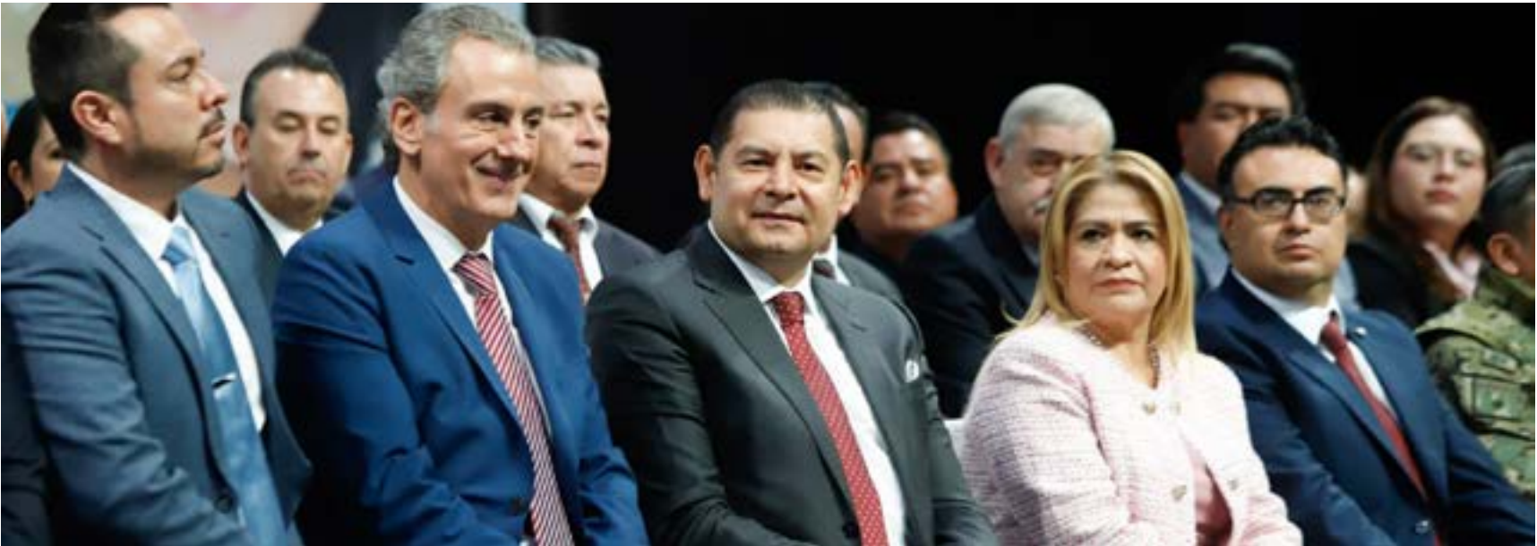
ALEJANDRO ARMENTA GOBERNADOR CONSTITUCIONAL DEL ESTADO DE PUEBLA

Con el PED 2024 -2030 en mano y con amor a Puebla, es un honor asumir esta responsabilidad y ser parte con todas las poblanas y los poblanos, de la Cuarta Transformación en el Estado.