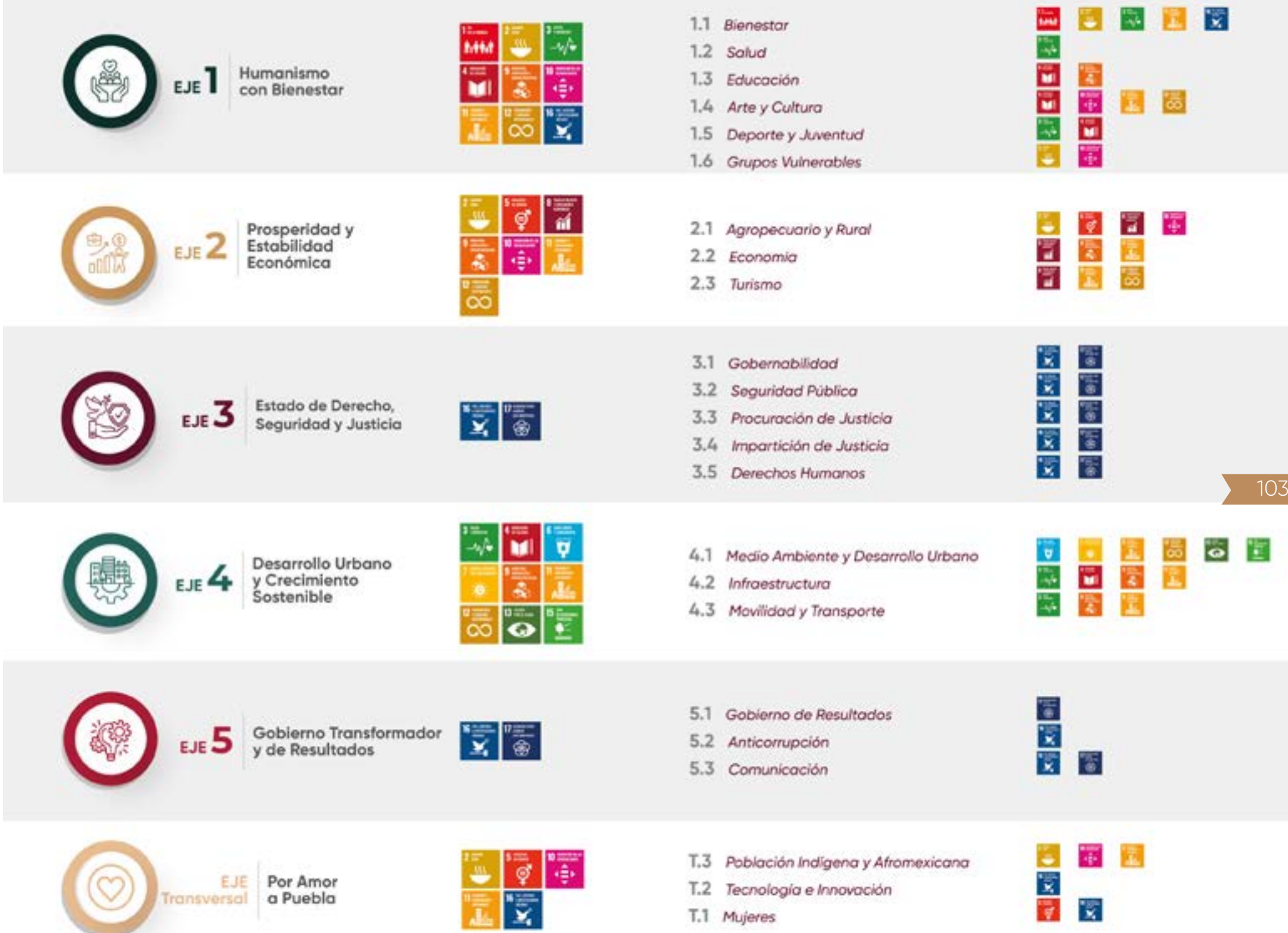
Esquema 6. Alineación del Plan Estatal de Desarrollo 2024-2030 con los Objetivos de Desarrollo Sostenible.