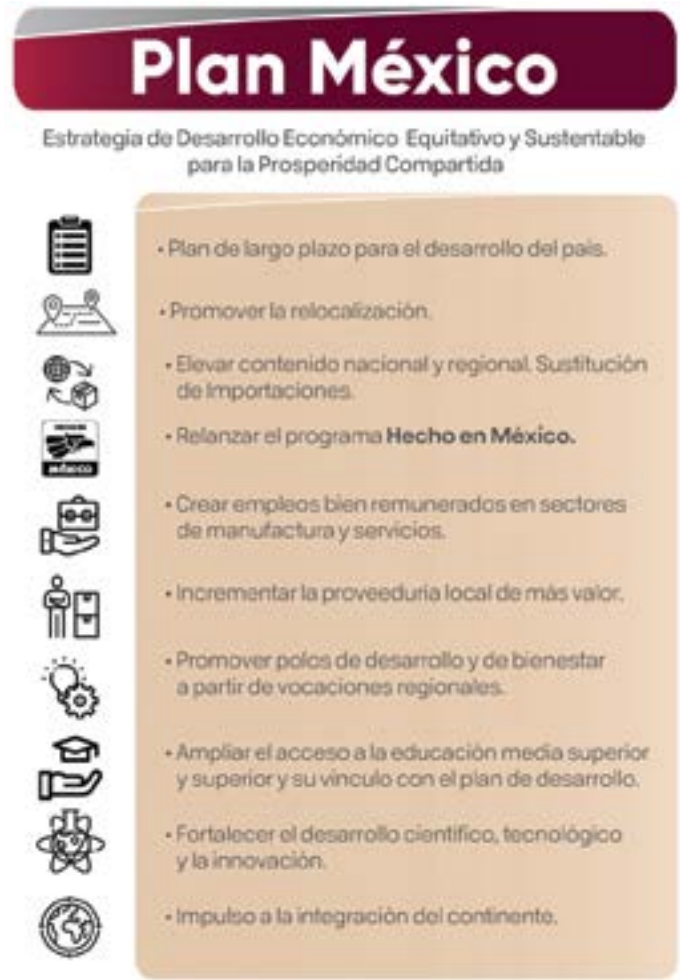
Esquema 4. Estrategia de Desarrollo Nacional