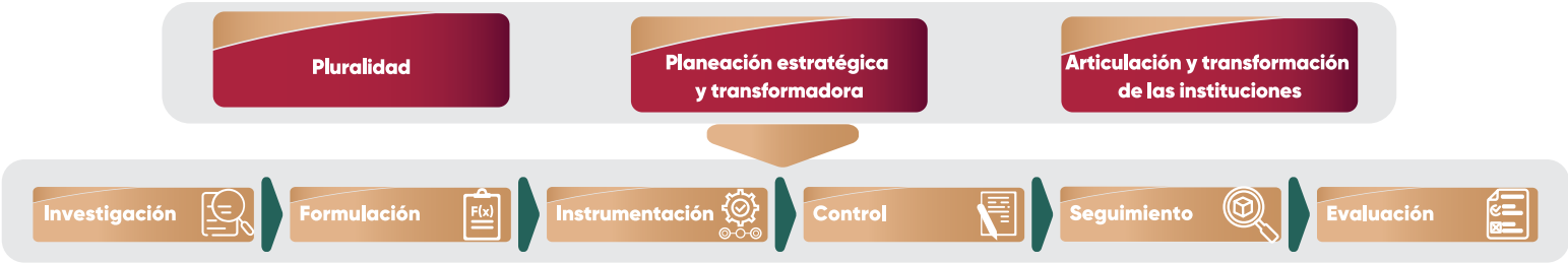
Esquema 1. Etapas del Proceso de Planeación.

Fuentes: SPfYA. Subsecretaría de Planeación. Elaboración propia con base en la información de la Ley de Planeación para el Desarrollo del Estado de Puebla, artículo 41 y la Guía para la Elaboración del PED 2024-2030 aprobada en la primera sesión extraordinaria del COPLADEP, diciembre 2024.