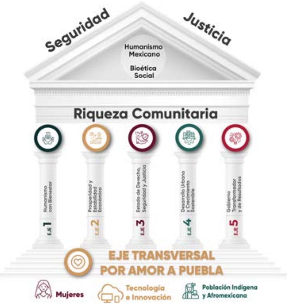
Esquema 2. Pilares de Desarrollo del Estado